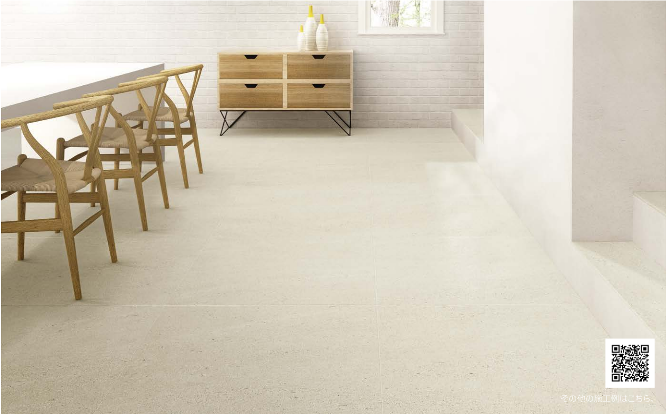
その他の施工例はこちら。