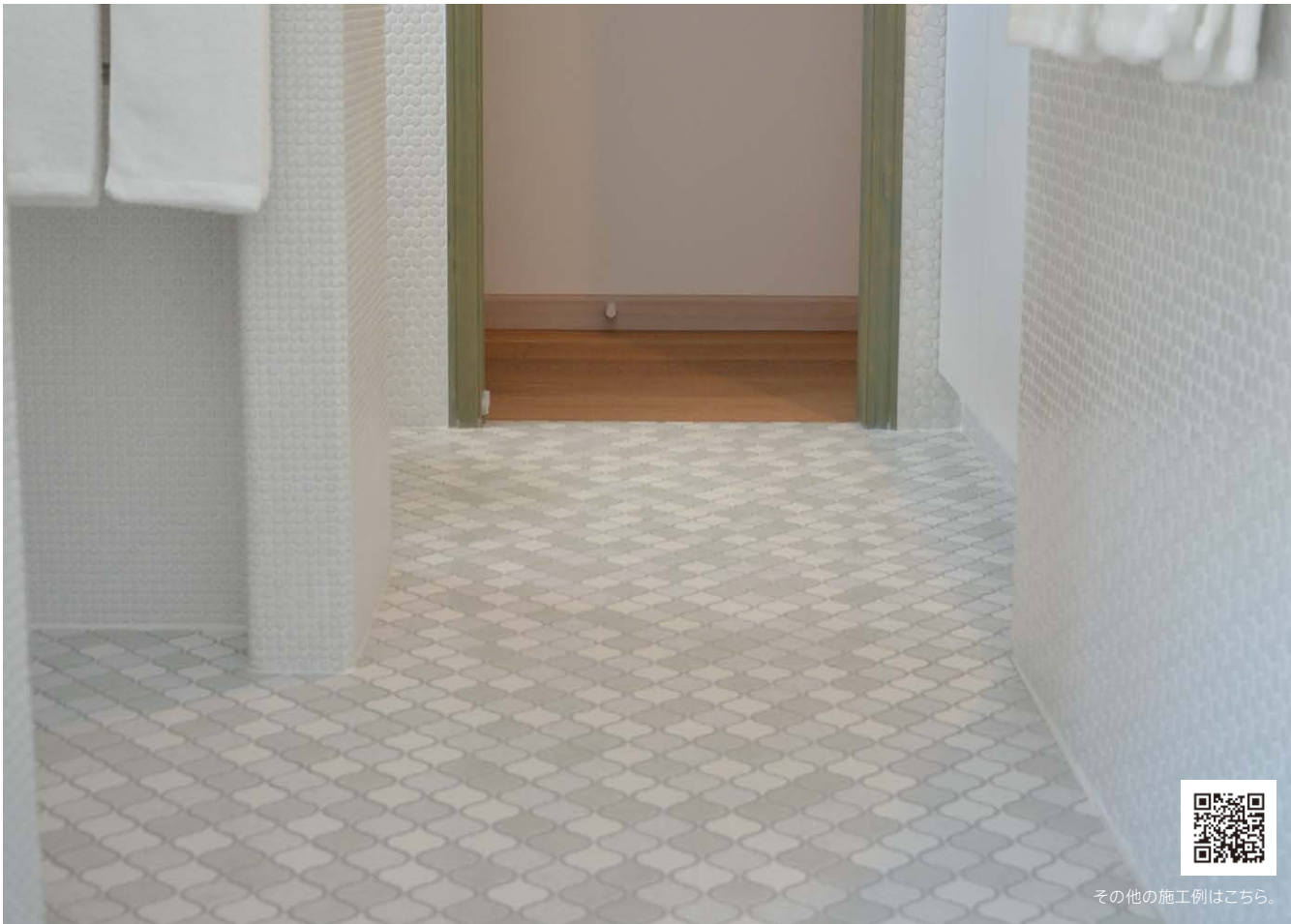
その他の施工例はこちら。