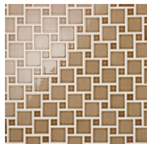
Pattern B m 2 必要枚数 16シート/m 2 設計価格 ¥18,500/m 2