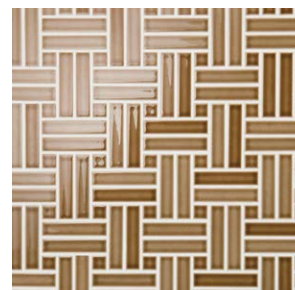
Pattern K m 2 必要枚数 11.2シート/m 2 設計価格 ¥18,500/m 2