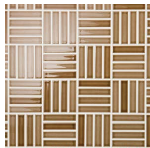
Pattern J m 2 必要枚数 11.2シート/m 2 設計価格 ¥18,500/m 2