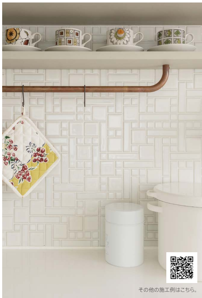
その他の施工例はこちら。