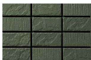
NT-452/WD-18 消炭 (けしずみ) (9.6R4.1/0.6)