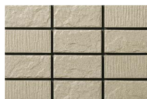
NT-452/WD-12 利休白茶 (りきゅうしらちゃ) (10.0YR6.1/1.5)