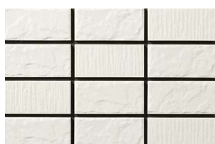
NT-452/WD-20 淡雪 (あわゆき) (2.5YR8.4/0.6)

■注意事項については、各カテゴリーの中扉に明記してあります。ご参照ください。また、詳しくは各営業までお問い合わせください。