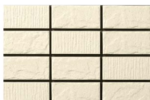
NT-452/WD-2 晒 (さらし) (2.5YR8.4/0.6)