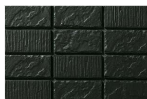
NT-452/WD-19 墨 (すみ) (6.0RP3.0/0.4)