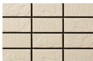
NT-452/WD-9 砥粉 (とどこ) (9.5YR7.5/1.8)