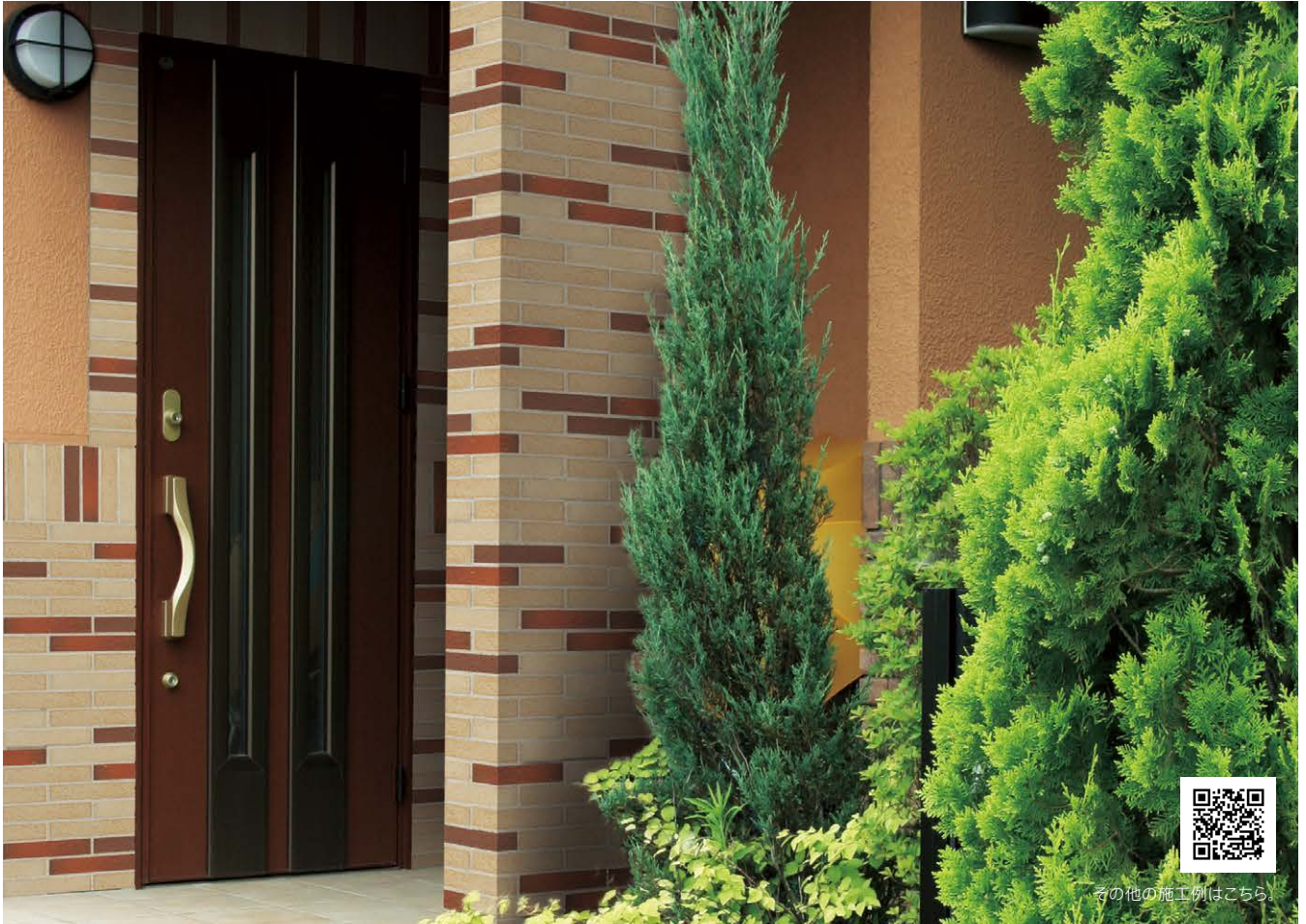
TAN-227/2 · 4