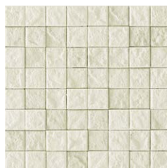
JUN II /MC-35 (ライム)