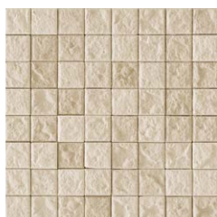
JUN II /MC-36 (コーラル)