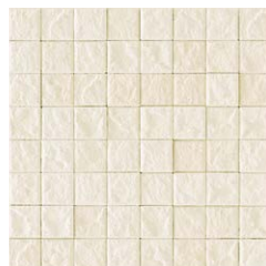
JUN II /MC-33 (ベージュ)