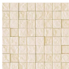
JUN II /MC-34 (ライトブラウン)