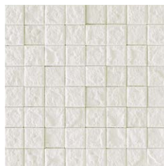
JUN II /MC-32 (アイボリー)