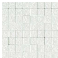
JUN II /MC-31 (ホワイト)