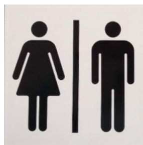
3: 女子 / 男子